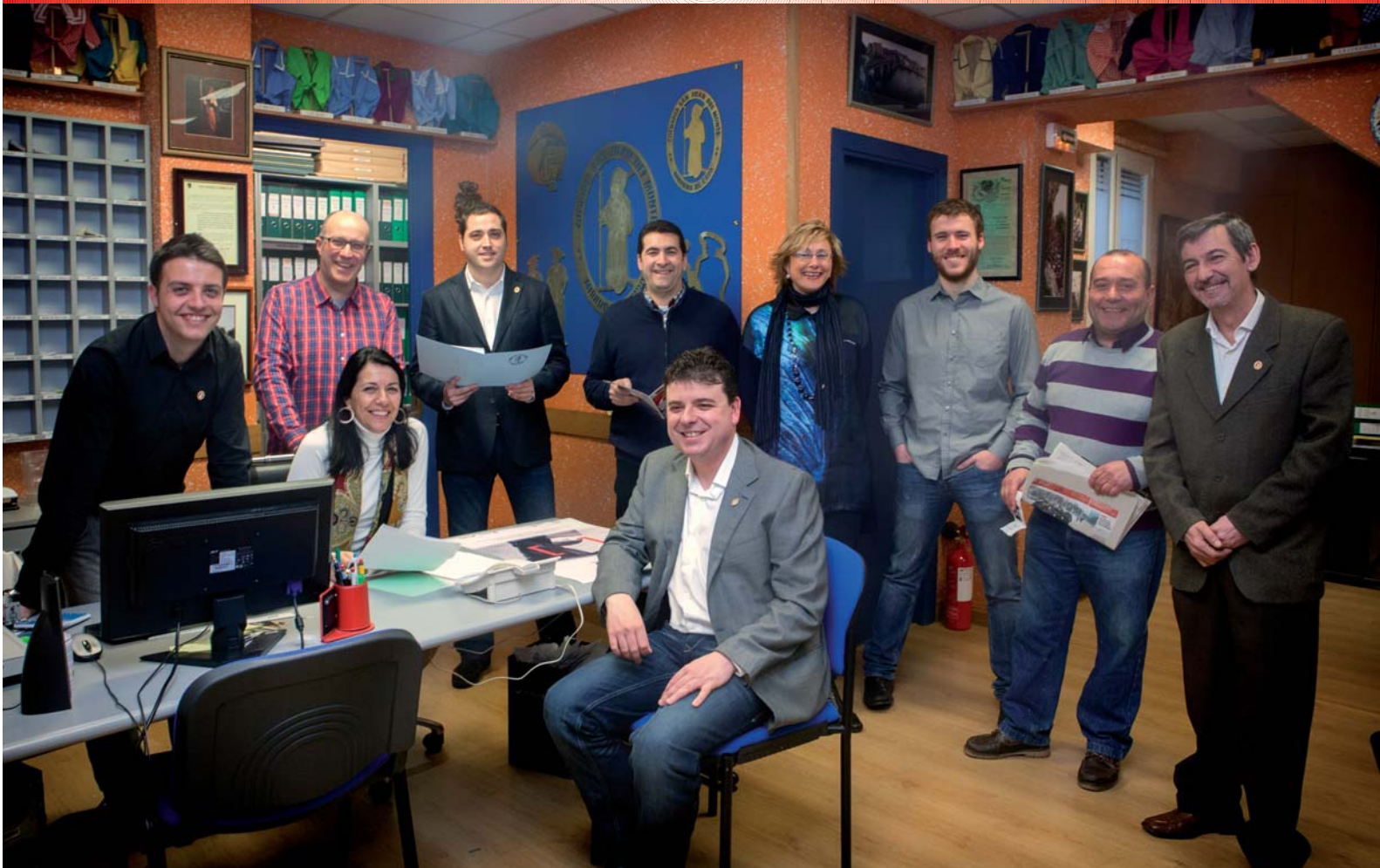
Sanjuaneras y Sanjuaneros 2012