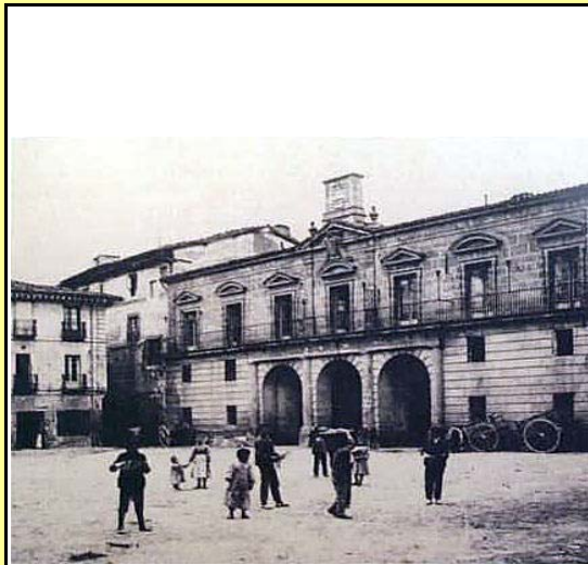
Foto de Época

El desarrollo de Miranda de Ebro y la paulatina asunción de mayores responsabilidades y tareas administrativas por parte de su Consistorio, han hecho necesario el traslado de algunas dependencias municipales a la edificación adyacente de la antigua alhóndiga, abriéndose un paso para comunicar ambos.