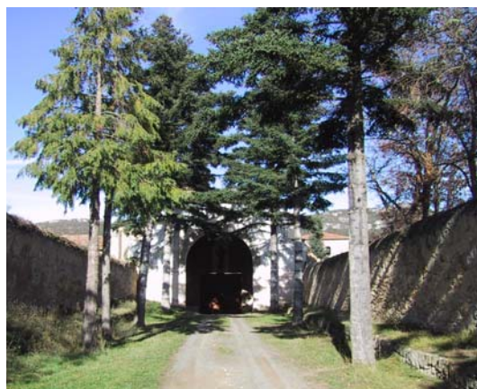
Camino de entrada