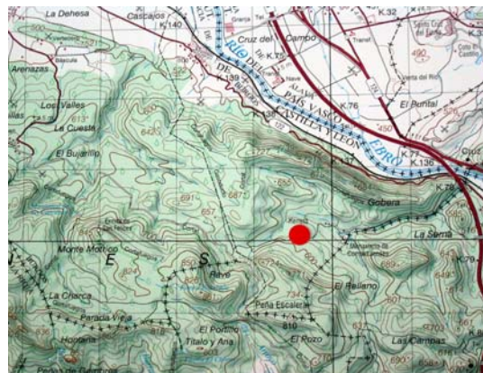
Situación en plano

El resto del monasterio de Herrera tiene varias dependencias donde abundan ya los edificios renacentistas y algunos todavía góticos, además de la magnífica espadaña barroca que preside todo el conjunto.