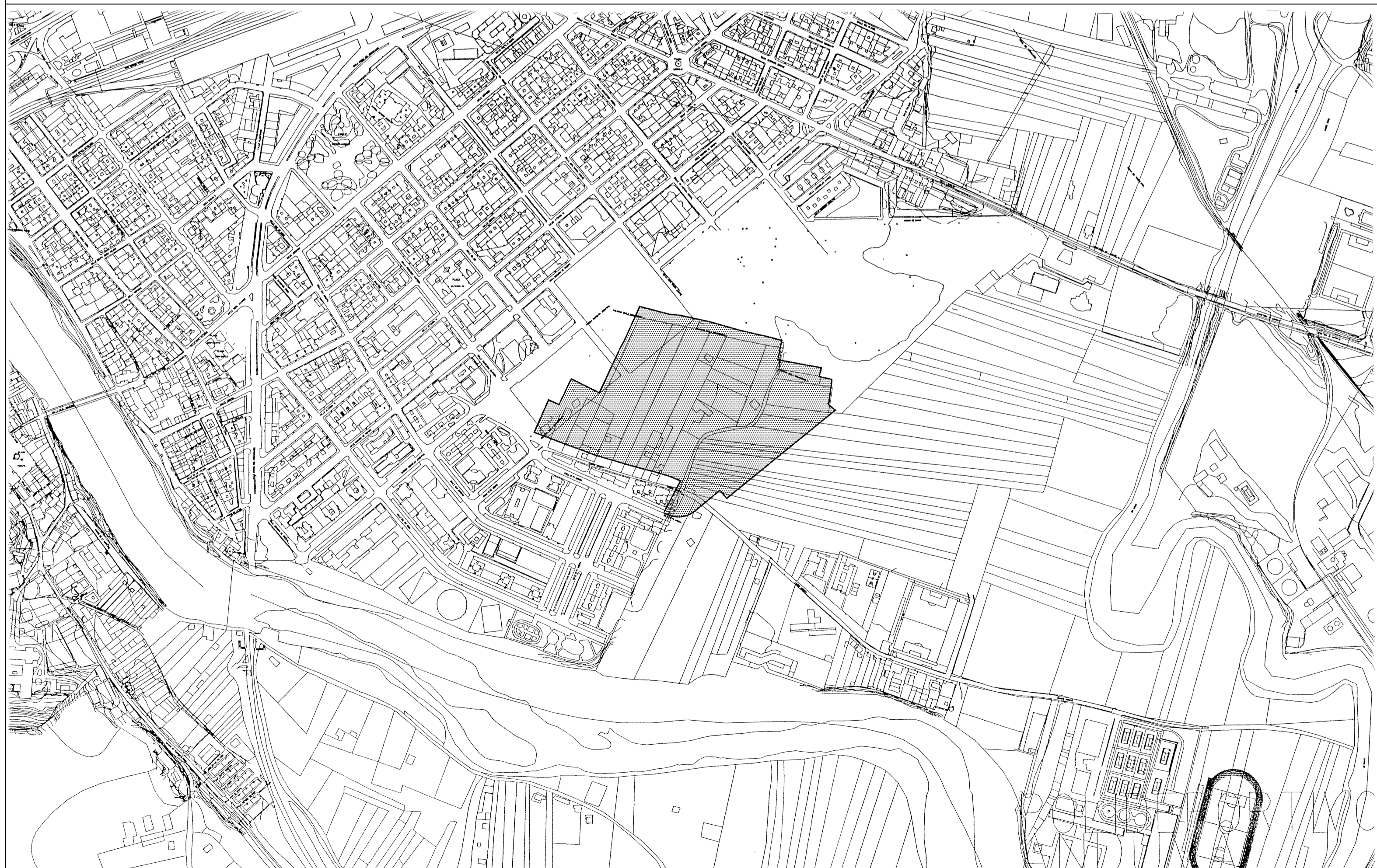
PLANO DE EMPLAZAMIENTO E:1/5.000