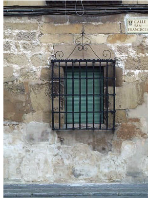
San Francisco 7