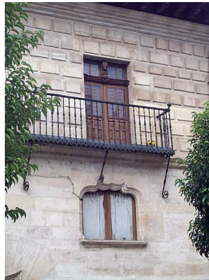
Plaza España 5