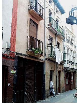
San Juan 16