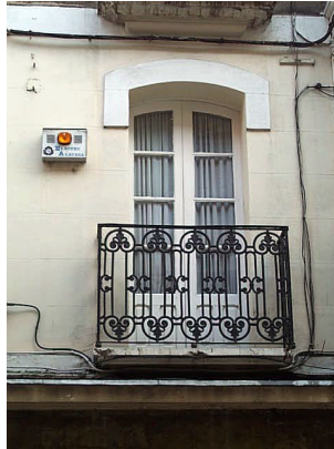
Real Aquende 22