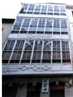
San Juan 38