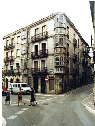
De la Fuente 1