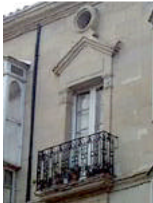
Leopoldo Lewin 2