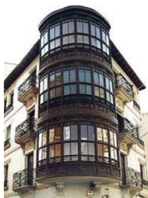
Santa Lucía 21