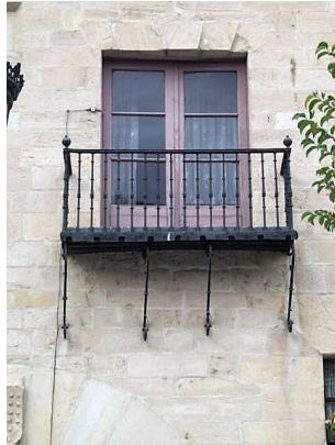
Plaza España 4