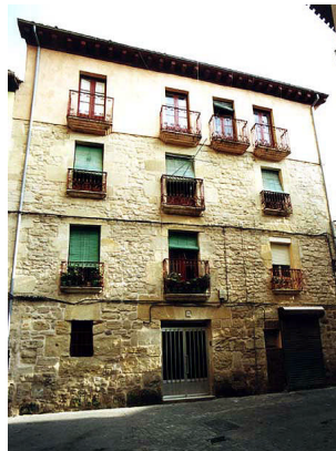
Sta María 9