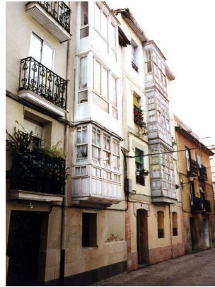
La Reja 11