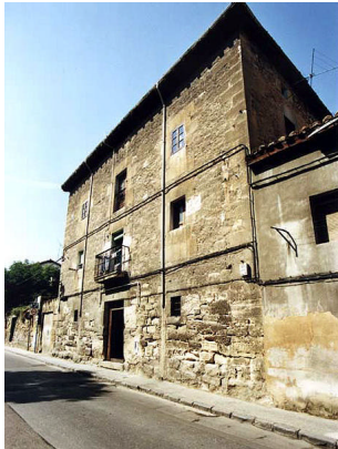
Real Aquende 36