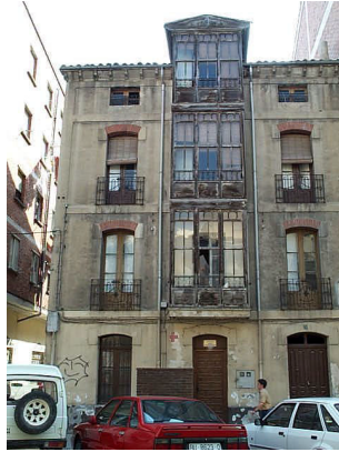
Santa Lucía 15