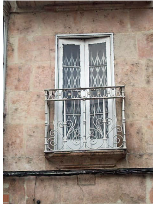
San Juan 1