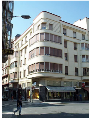
Santa Lucía 2