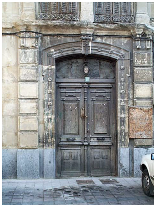
Real Allende 10