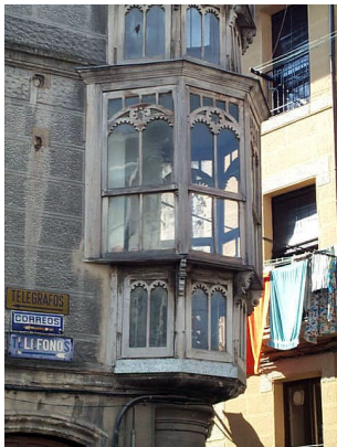
La Fuente 1