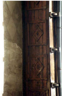
Santa Lucía 37