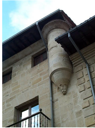
Plaza España 4