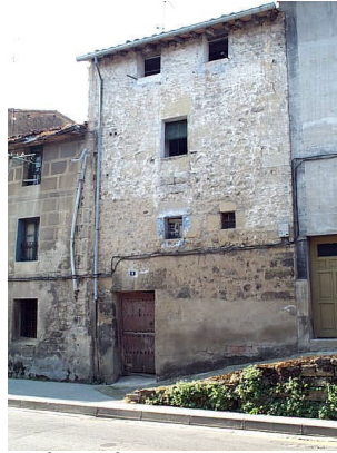
Real Aquende 8