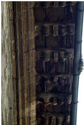
San Francisco 7