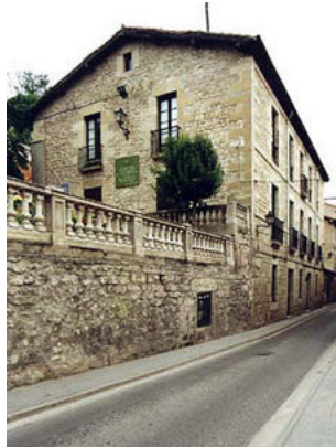
De la Fuente 22