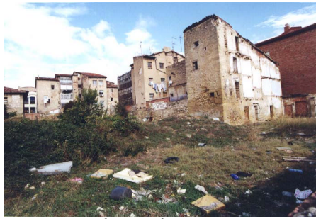
Manzana San Nicolás - Arenal