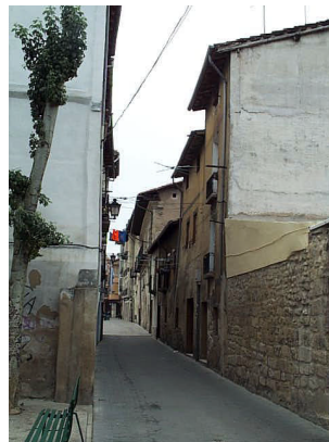
Calle San Llorente