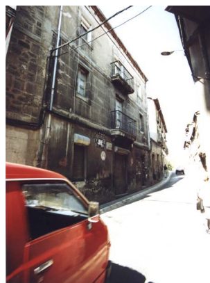
Calle Real Aquende