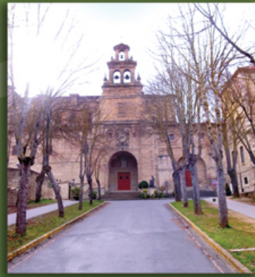
1. Sagrados Corazones