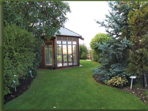
2. Jardín Botánico