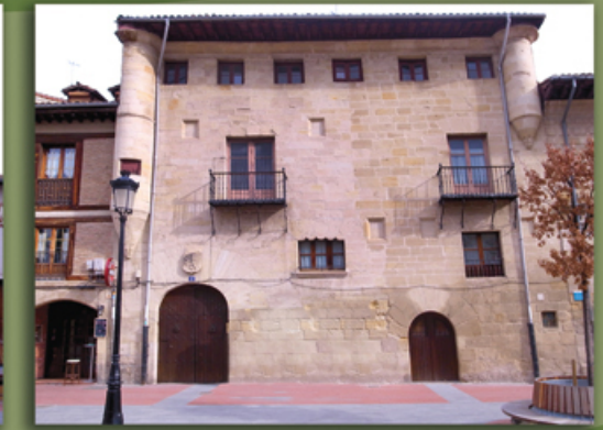
6. Casa de los Urbina