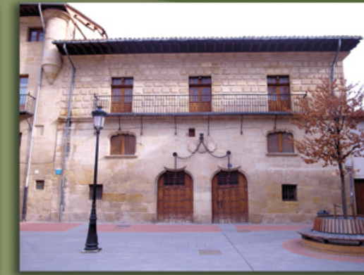
5. Casa de las Cadenas