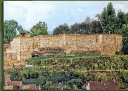
3. Castillo de Miranda