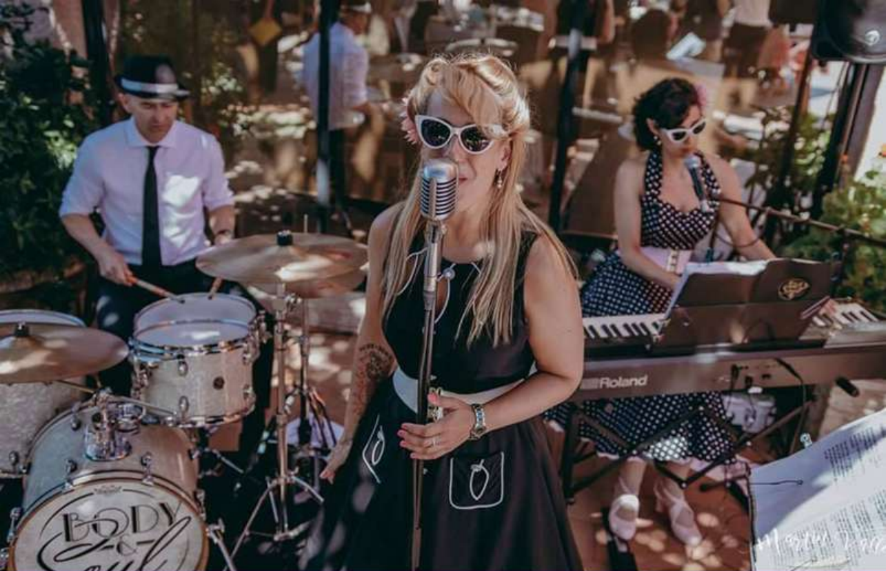
Body & Soul